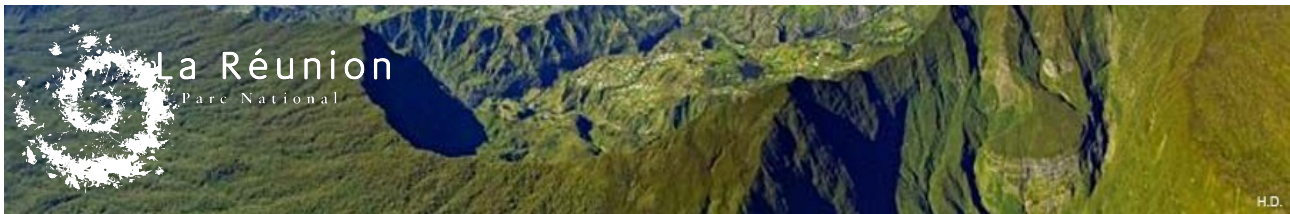
Planèze des Fougères